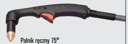
Palnik ręczny 75°

(więcej opcji palników można znaleźć w witrynie www.hypertherm.com )