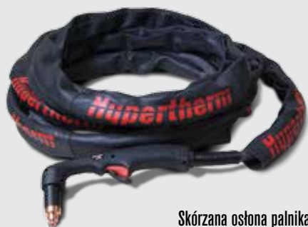
Skórzana osłona palnika