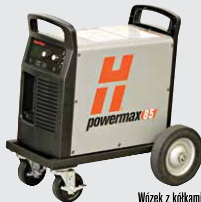
Wózek z kółkami