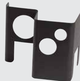
Zestaw do filtrowania powietrza