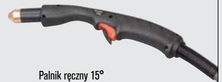
Palnik ręczny 15°