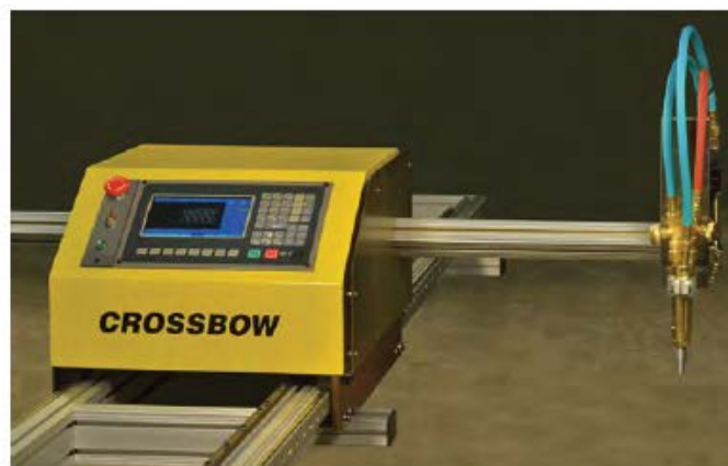
Maksymalna grubość cięcia w przypadku cięcia plazmowego – do 19 mm.