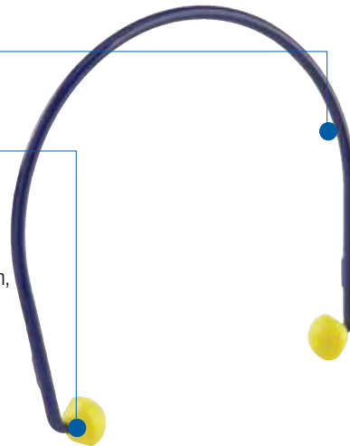
E-A-RCAPS™ (stosowane z pałąkiem w pozycji dolnej)