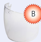
Osłona twarzy 5F-11