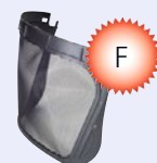
Osłona twarzy 5C