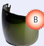
Osłona twarzy 5E-11