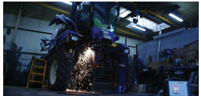
Serwis sprzętu rolniczego