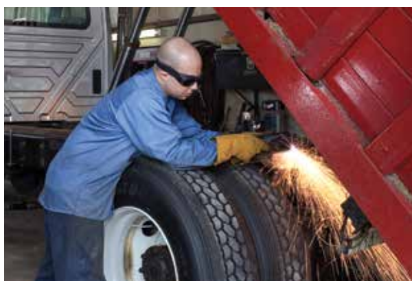
Naprawy i modyfikacje pojazdów