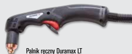
Palnik ręczny Duramax LT