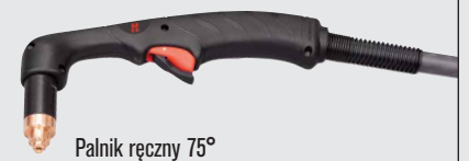
Palnik ręczny 75°

(więcej opcji palników można znaleźć w witrynie www.hypertherm.com )