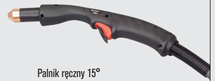
Palnik ręczny 15°