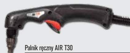
Palnik ręczny AIR T30