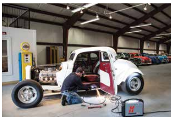
Naprawy i modyfikacje pojazdów