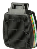
D8094 ABEKP3 R