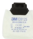
D3125 P2 R