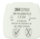
D7925 P2 R