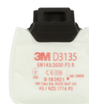
D3135 P3 R