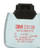
D3138 P3 R/ochrona przed pyłami i drażniącymi zapachami