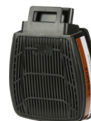
D8095 A2P3 R