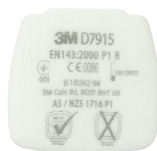
D7915 P1 R