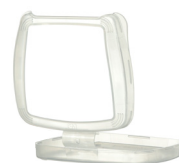
Pokrywa filtra D701

Półmaska serii HF-800 wraz z filtrami ma opór wdechowy poniżej 5 milibarów przy przepływie ciągłym 95 l/min.