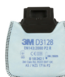
D3128 P2 R/ochrona przed pyłami i drażniącymi zapachami