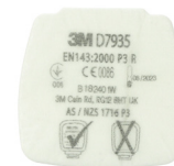
D7935 P3 R