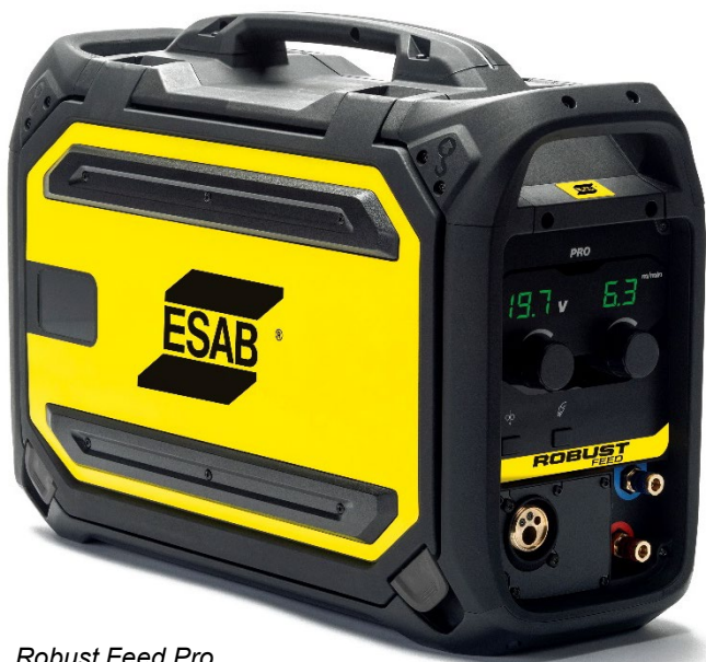
Robust Feed Pro