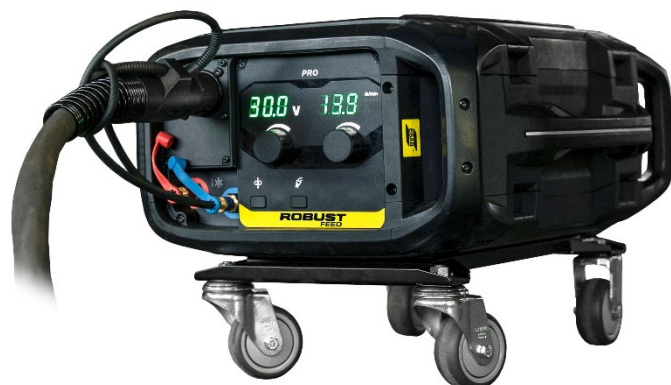
Zestaw kołowy współpracuje z podajnikiem poziomym lub pionowym

Podajnik Robust Feed PRO odznacza się ergonomiczną, solidną i szczelną konstrukcją oraz zapewnia nieocenioną pomoc w sytuacji, gdy kluczowe znaczenie mają takie cechy jak mobilność i wytrzymałość. Robust Feed PRO wyposażony jest w nowy precyzyjny system podawania drutu i odznacza się wystarczającą mocą do stosowania drutów litych o średnicy do 2,0 mm i rdzeniowych do 2,4 mm. Dostępne są również wersje do prac prowadzonych w terenie z rotametrycznym regulatorem przepływem gazu oraz grzałką w komorze podajnika. Podajnik Robust Feed Pro współpracuje z zasilaczami łuku typu Warrior.