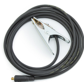
Earth return cable 10 m, 25 mm 2