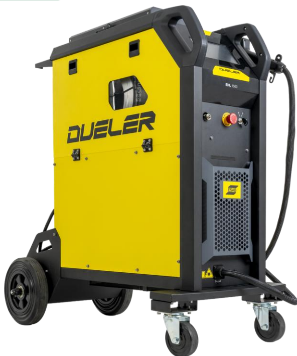
Dueler EHL 1500