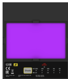
Filtr laserowy L-30

Odwiedź esab.com , aby uzyskać więcej informacji.