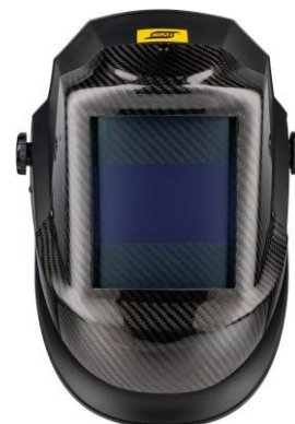
Przyłbica do spawania laserowego L-30