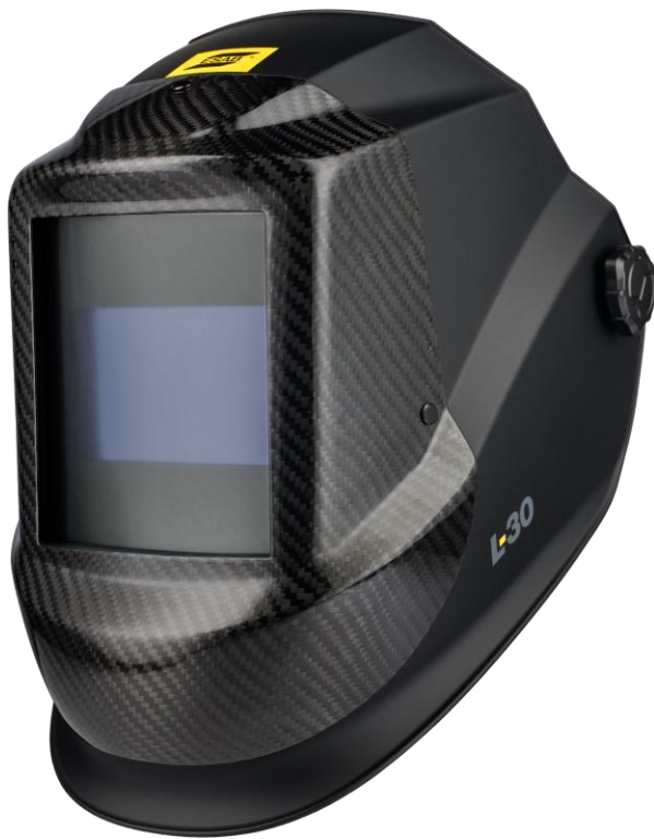
Przyłbica do spawania laserowego L-30